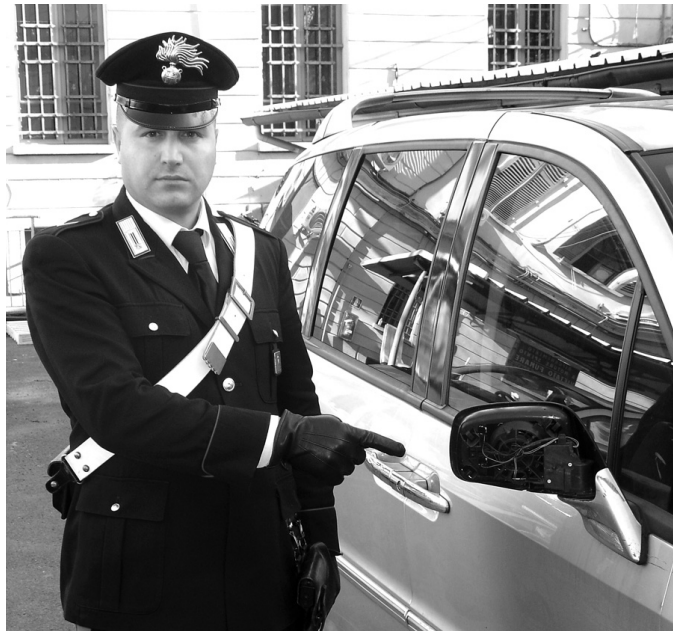
L'AUTO utilizzata per la "truffa dello specchietto"

Scippata da un passante, poco dopo ritrova la borsetta gettata a terra, ma completamente ripulita. È accaduto ieri a Novara, attorno a mezzogiorno, in via Roggia Ceresa. La donna, una 49enne, è stata raggiunta da un estraneo che le ha strappato la borsetta da dietro e poi è fuggito. Oltre ai documenti c'erano dentro 20 euro. Indagano i carabinieri.