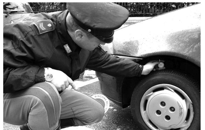
UN AGENTE mentre esegue un controllo su un battistrada

Fino a fine febbraio la Polizia stradale opererà 3.000 controlli su altrettanti mezzi di trasporto, che calcano le autostrade del territorio novarese. L'iniziativa intitolata "Inverno in sicurezza" è frutto di una campagna promossa dal Ministero dell'interno e da Assogomma. I controlli della Stradale mireranno dunque ad accertare che i mezzi in circolazione siano muniti di pneumatici corrispondenti alla carta di circolazione, che siano omologati, che non abbiano danni visibili ad occhio nudo e che abbiano una profondità del battistrada di almeno 1,6 mm come prescritto dalla legge. I pneumatici sono l'elemento primario. L'usura è causa di un allungamento della frenata: "ad esempio - spiegano i promotori della campagna - in caso di pioggia raddoppia rispetto ad un pneumatico in buono stato, e questo può davvero fare la differenza in una situazione di emergenza".